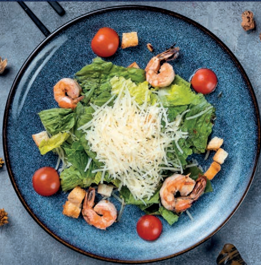
Цезарь с креветками