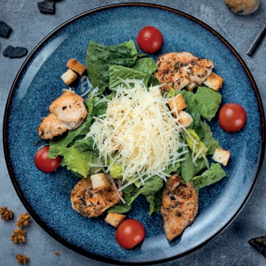
Цезарь с курицей