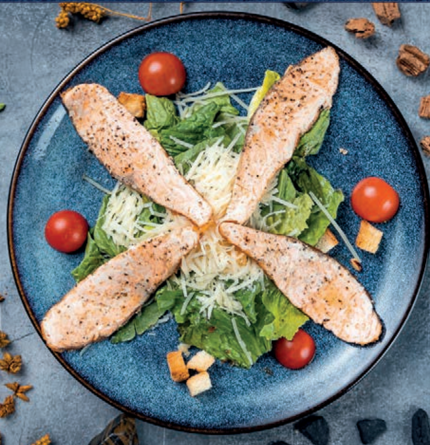
Цезарь с жареным лососем