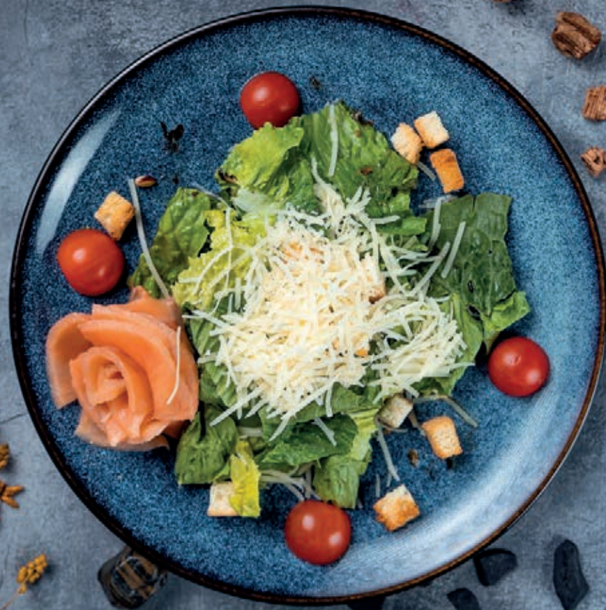
Цезарь с лососем слабого посола